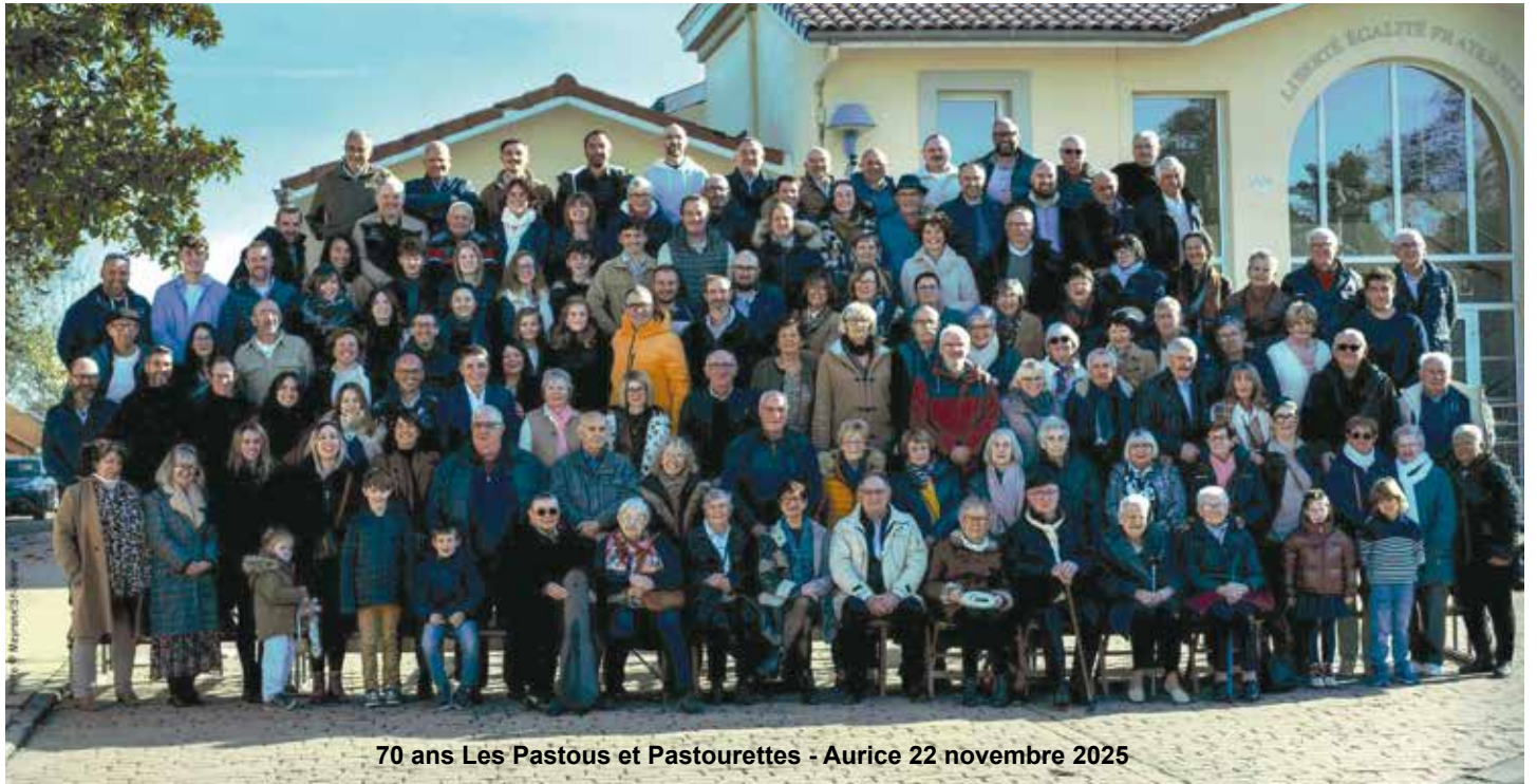
70 ans Les Pastous et Pastourettes - Aurice 22 novembre 2025